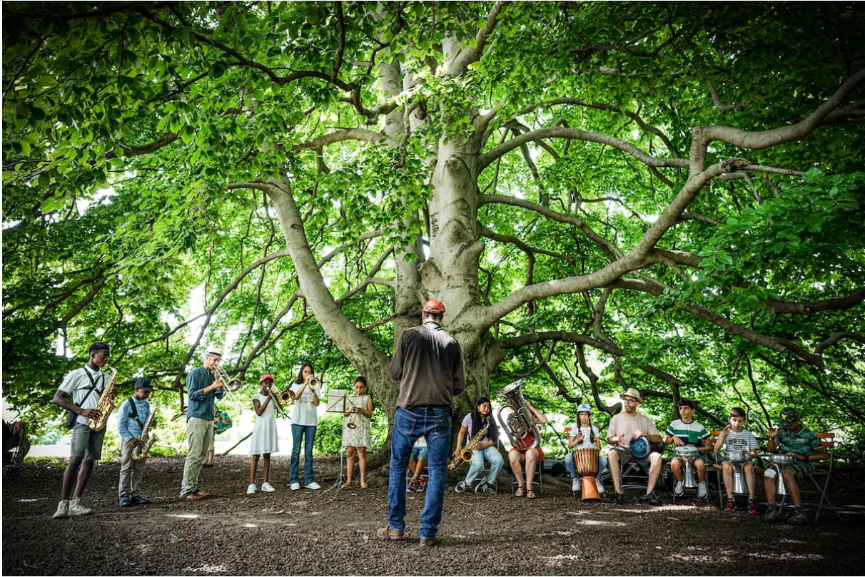
Fanfare des enfants migrants au concert de la Fête de la musique juin 2021, Parc la Grange.